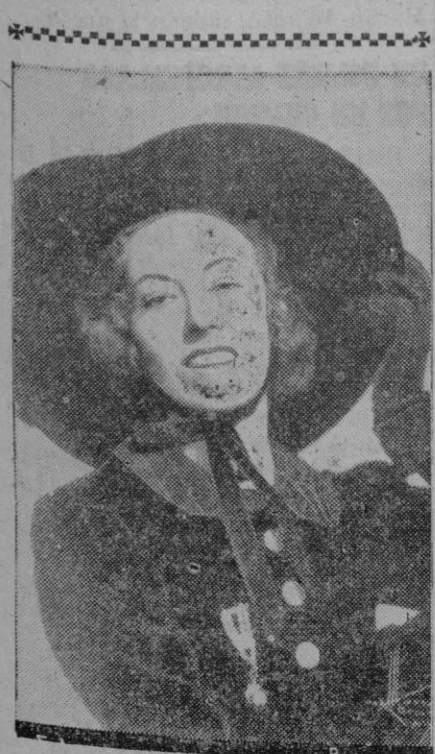
Una linda mejicana que no se ha vestido así por un simple capricho. Entre un centenar de bellezas americanas fué elegida para servir de modelo a una enorme fotografía que había de colocarse a la entrada de una exposición universal. Y para ello tenía que llevar ese atuendo precisamente

Zaragoza, 12.—Sus Excelencias el Jefe del Estado y su esposa acompañados de los primeros y segundos jefes de sus Casas Civil y Militar y de los ministros de la Gobernación, Industria, Comercio y del Aire, visitaron a primera hora de la tarde la feria oficial y nacional de Muestras de Zaragoza. Un gran gentío se había congregado en las inmediaciones del Palacio Ferial y tributó a Sus Excelencias un cordialísimo recibimiento con vítores y aclamaciones.