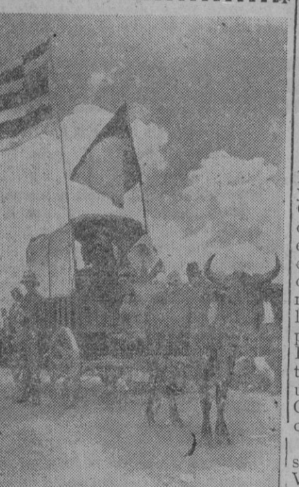
La escena nos representa una parte de una fiesta de las caravanas de boers en Africa del Sur. Un carro de bueyes—por aquí sería un carro—que tomó parte en las fiestas del programa

A las seis entró el Caudillo en la ciudad, acompañado de su esposa, excelentísima señora doña Carmen Polo de Franco; del ministro de la Gobernación, y de los jefes, primero y segundo, de sus Casas Civil y Militar.