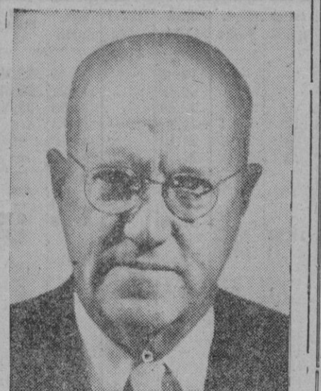
William Borberg, delegado permanente de Dinamarca en la O. N. U. y ahora nuevo presidente del Consejo de Seguridad

Washington, 11.—Los Estados Unidos, Australia y Nueva Zelanda han iniciado conversaciones para estrechar las líneas defensivas aliadas en el sureste asiático y en el Pacífico occidental.