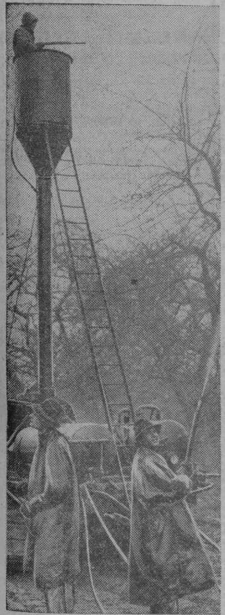
Un buen método de desinfección de los árboles frutales. Mientras uno de los operarios, en lo alto de esa torre, dirige el riego desinfectante a las ramas más altas, los otros lo hacen desde el suelo a las más bajas, completando así en breves minutos toda la labor.

La suscripción de una «Ficha Azul» de Auxilio Social, supone para usted un pequenísimo desembolso mensual y contribuirá en gran parte al alivio de muchas necesidades.