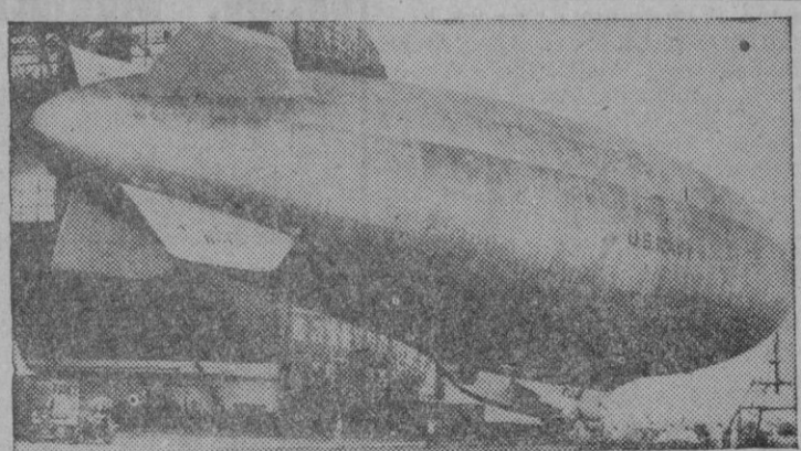
A la vista de los gigantes aparatos que surcan hoy el espacio, con o sin alas en delta, en forma o no de los tan traídos y llevados "planchos volantes", cualquiera pensaría ya que el zepelín había pasado siempre a las páginas de la historia. Pero no. No hace mucho la Armada de los Estados Unidos probaba este zepelín ZPN-1, la aeronave más grande del mundo, construido para prestar servicios antisubmarinos. Está equipado con los más modernos adelantos y dispositivos para localizar y tocar a los submarinos enemigos.