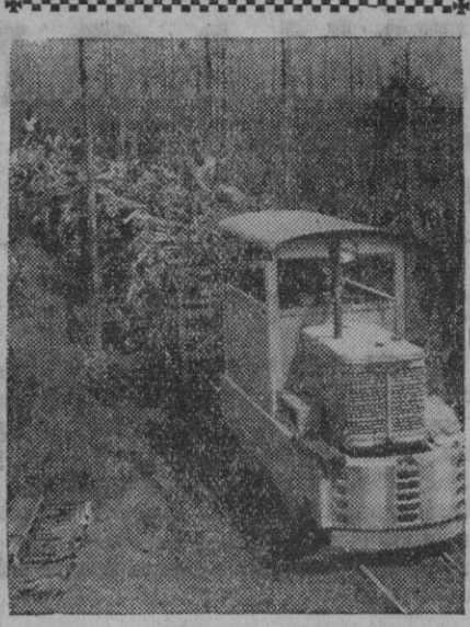
Este es un tren íntimamente ligado a la agricultura, puesto que su destino no es otro que el transporte de la producción de sisal en una explotación africana. Esta fibra, hoy tan utilizada, se exporta desde allí en grandes cantidades a distintos países del mundo