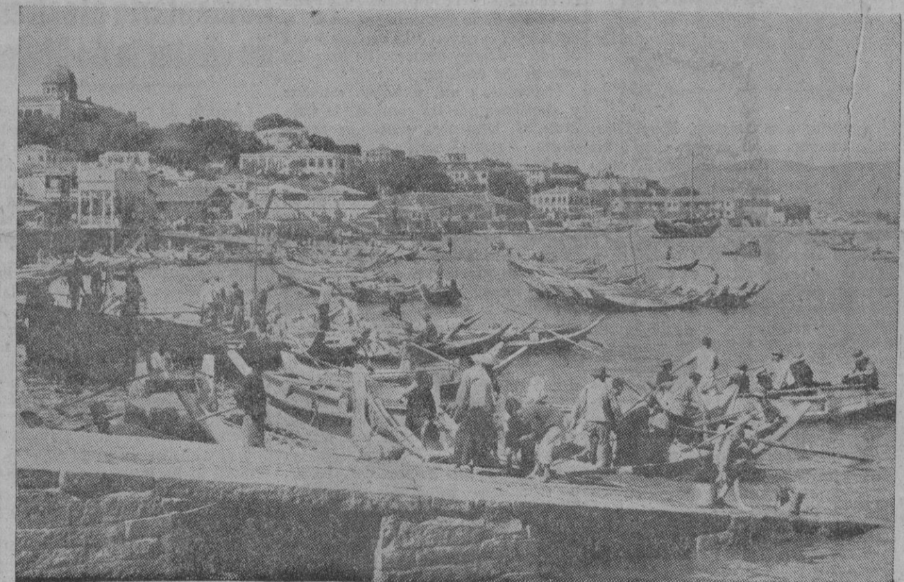
Vista del puerto de Amoy, ciudad que está siendo machacada por la aviación nacionalista china, con el objeto de aplastar la intenciona comunista de invadir la isla de Quemoy

La reserva de energía eléctrica disponible ha disminuido en 65,4 millones de kilowatios hora. Existen 692,6 millones que representan el 25 por 100 de la que debiera haber si los pantanos estuviesen completamente llenos.