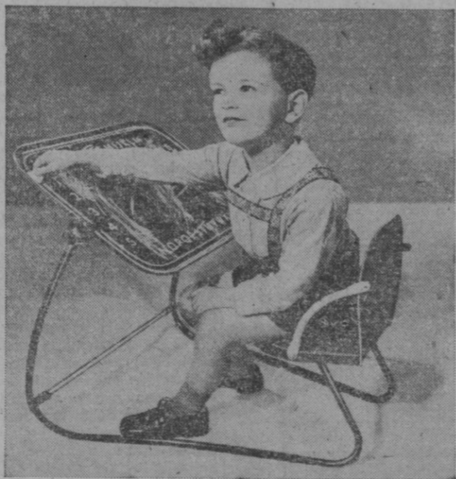
La infancia también tiene derecho. Y si los mayorzotes gozan de buenos y cómodos sillones, despachos y ese etcétera que podemos agregar, también los pequeños tienen sus derechos, y no está mal adquirirles una sillaneta como la presente que, además, tiene la ventaja de que pueden pintarse en ella sin necesidad de hacerlo en las paredes.

Todos los condecorados, desde sus distintos puestos, han desarrollado su cometido con el mayor celo y entusiasmo, que ahora se ve reconocido con esta merecida recompensa.