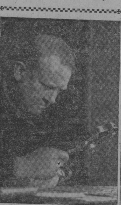
Aquí tienen ustedes un hombre abstraído. Ensimismado en su lupa o, mejor dicho, en lo que ve a través de ella, seguramente que ni se dio cuenta del fotógrafo. ¿Qué mira? Lo que se puede mirar con lupa: sellos o insectos, Aficiones y manías...

Nueva York, 22.—Más de dos mil cuatrocientos artículos de la artesanía española se presentan en la II Exposición de Artículos de Regalo y Fantasía, que se ha inaugurado a la una de la tarde de hoy (hora local) en el hotel Astor, en el gran salón de baile. La Exposición se clausurará el viernes, y a su apertura oficial han concurrido representantes del Municipio neoyorquino y de los países extranjeros que toman parte en ella. Son cuarenta y una las naciones, territorios y colonias participantes. Se esperan unos veinte mil visitantes, principalmente comerciantes. Es la primera vez que España toma parte en una Exposición de este tipo en Nueva York.