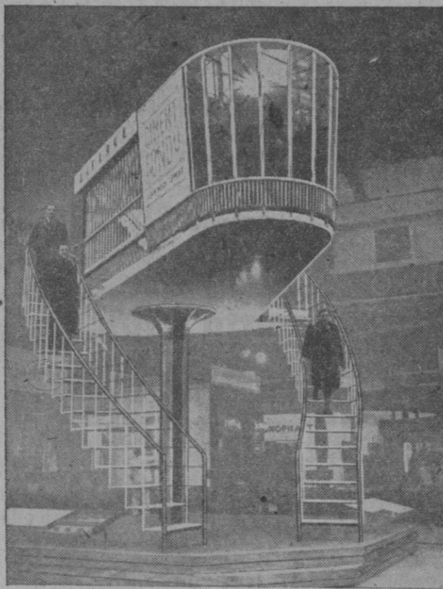
Indudablemente que este artefacto puede presentarse con toda dignidad en una exposición—como en realidad ha sucedido—ya que sus características son de sobra llamativas para que así suceda, y con éxito. Se trata de una plataforma de hormigón, sometida previamente a grandes esfuerzos y que ahí donde la ven ustades fué expuesta a las 24 horas de haber sido construida