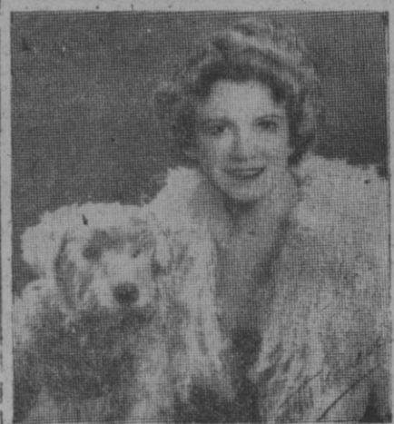
Ustedes habrán oído su nombre infinidad de veces, sobre todo ellas. Por algo lo llevan algunos cosméticos también. Pero seguramente que su fotografía no la habrán visto mucho. Ahí la tienen. Elizabeth Arden, experta en belleza y no poco bella también

La Haya, 28 (4 t.).—La delegación de Indonesia confía en que probablemente el viernes de esta semana será firmado un acuerdo oficial con Holanda que ponga fin a la unión entre los dos países. La ceremonia de la firma se aplazó a última hora del sábado a petición de la delegación indonesia, que se enteró de que el primer ministro, doctor Sastroamidjojo, aún no había visto el informe final de la delegación.—Efe.