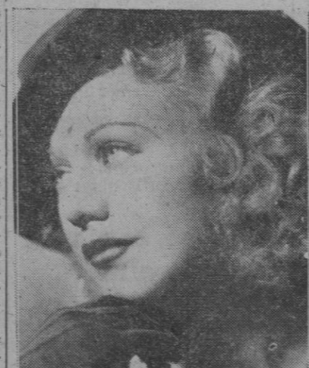
Hace ya unos "cuantos" años Ginger Rogers era así. Después, naturalmente, vinieron los años, pasaron y cualquiera la conocería...

6. Una comisión supervisora de tres naciones, que serán, casi seguramente, Canadá, India y Polonia.