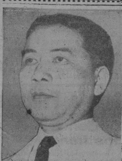
Ngo Dinh Dien, primer ministro del Vietnam, recientemente nombrado, y que ha formado un nuevo Gabinete. Es católico

en la Embajada, a la colonia española. Por la tarde se corrió en el Hipódromo Gavea «El Gran Premio de España», entregando el embajador la copa al vencedor. A continuación se celebró una recepción al Cuerpo diplomático, autoridades del mundo internacional y político, lo que resultó un señalado éxito social, con asistencia de las más altas jerarquías de la nación. La fiesta se prolongó durante la noche, en un ambiente de suma simpatía.—Efe.