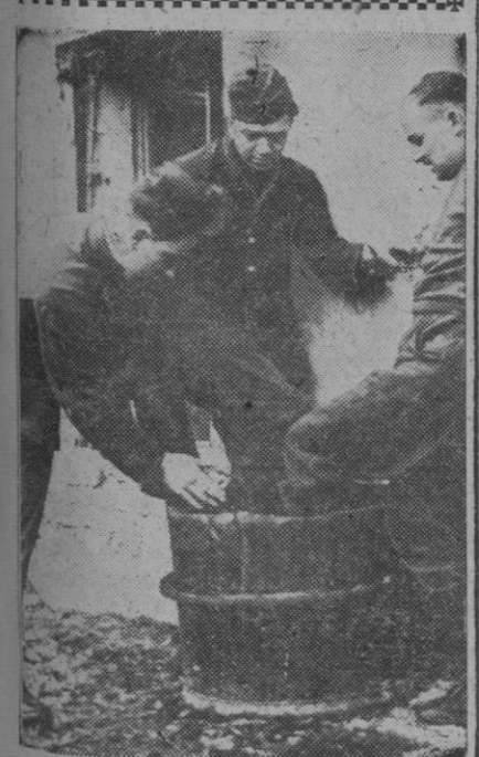
En el patio del cuartel, cuando las tropas se encuentran repletas de barro. Por cualquier motivo o circunstancia, para estos soldados parece más cómodo meterlas en un cubo de agua, que molestarse en quitárselas para su adecuada limpieza.