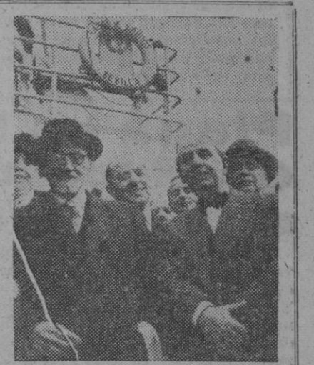
Benavente, en el puerto de Barcelona, rodeado por una comisión de la Sociedad de Autores

El entierro se efectuará mañana, a las cinco de la tarde. Pasará por delante del teatro María Guerrero y después por Recoletos y la Cibeles partirá a Galapagar, donde por disposición testamentaria recibirá sepultura los restos del Premio Nobel.—Cifra.