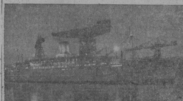
cecillas que se escapan de los ojos de bucy de los camarotes y las restantes dependencias del barco.

Sevilla, 22.—Su excelencia el generalísimo Trujillo abandonó el hotel donde se aloja a hora muy temprana y, acompañado de varias personalidades de su séquito y de sus ayudantes de servicio, se trasladó al yate «Presidente Trujillo», en el que permaneció durante varias horas. A media mañana marchó a los astilleros que a ocho kilómetros de la ciudad, en el sector conocido por «Punta del Verde», tiene la Empresa Nacional Elcano.