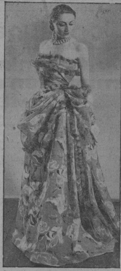
Para ellas, un bonito modelo de traje de noche que, según nos dicen, ha sido presentado por una de las mejores modistas londinenses

Avisados los bomberos, consiguieron dominar las llamas y salvar al suicida. Este, por orden facultativa, fué internado en un establecimiento psiquiátrico por estar enfermo. Las pérdidas se elevan a unas cien mil pesetas y no ha habido que lamentar desgracias personales.—Cifra.