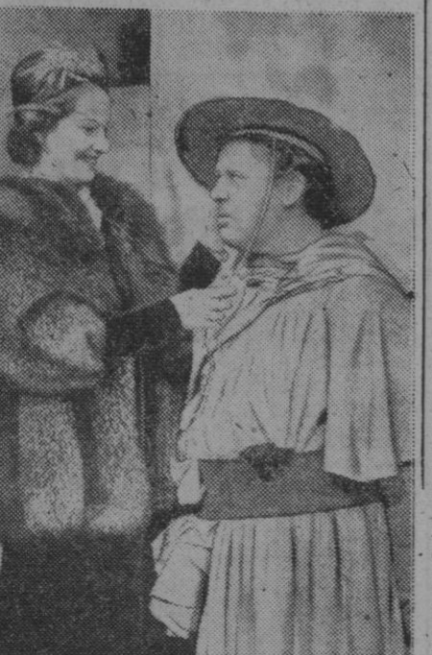
Si, ella rie graciosamente ante la bonita "estampa" del galán que la mira un tanto indignado por su sonrisa semiburlesca. Y es verdad que el atuendo le sienta bastante mal. En resumen, diversiones de cineastas en ratos libres entre el rodaje de los distintos planos de la película