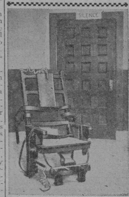
Desde luego que sólo de contemplarla da escalofríos. Y no sabe uno si ella será mejor o peor que su prima hermana la guillotina. Pero ahí está, la silla eléctrica, esperando avarienta, descargar su mortal sacudida sobre algún desgraciado. ¡Y habrán pasado tantos por ella!

Ayer llegó a Madrid el generalísimo dominicano don Rafael Leónidas Trujillo, siendo recibido, además de por el Caudillo y personalidades oficiales, por el clamor popular, pues sabemos los españoles que nuestro ilustre visitante ha sido siempre un gran amigo de nuestra Patria. Es el generalísimo Trujillo una de las figuras más representativas del mundo hispánico, en cuyo concepto supo penetrar el ex presidente dominicano con singular emoción y agudeza. Nuestro visitante tiene una destacada personalidad política y militar, pues ha sabido encarnar plenamente los anhelos y la misión del pueblo de Santo Domingo, que ocupa un lugar destacado en el mundo hispanamericano y cuya actitud en momentos difíciles para nosotros fue noble, generosa y enérgica, lo cual merece la gratitud de todos los españoles. El nos defendió en la O. N. U. reclamando el fin de la conjura contra nuestra Patria, señalando lo absurdo e injusto del cerco diplomático.