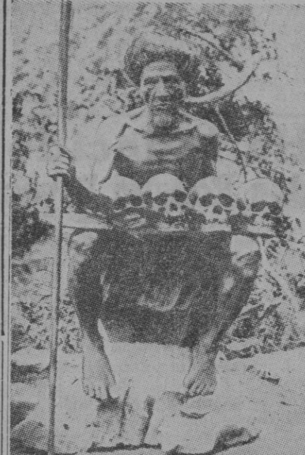
A veces cuando oímos hablar de tribus salvajes, nos parece que éstas existen sólo ya en el cine y las novelas de aventuras. Pero no; ellas no han desaparecido del planeta, o mejor dicho, aún no ha llegado hasta ellas la cultura y la civilización. Ahí está, como ejemplo, este coleccionador de cráneos, que puede ser por allá una afición, como por aquí la filatelia, por ejemplo