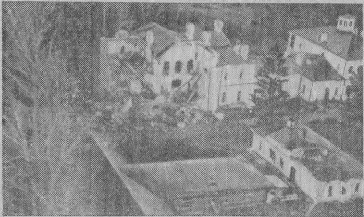
Por aquí ha pasado la guerra. El hotelito semiderruido lo delata. O cuando menos algún otro grave accidente. Las consecuencias pueden haber sido las mismas. Muertos, heridos, o la precipitada huida ante el derrumbamiento

Valencia, 6.—Esta mañana han llegado las unidades de la VI Flota norteamericana, que permanecerán en este puerto hasta el día 13. Son el crucero «Newport News», de 21.500 toneladas; el portaaviones «Randolph», de 33.000; el dragaminas «Doyle», de 2.575; el destructor «Dyess», de 3.300; el submarino «Tirante», de 1.570; la unidad de desembarco «L. S. T.-533», de 4.500; el petrolero «Kankakee», de 21.850, y el también petrolero «Severn», de 25.400 toneladas. Desde el día 2 se encuentran ya en el puerto el buque-tanque «Nespelem», de 22.000 toneladas, y mañana es esperado el petrolero «Concun», de 20.000, con lo que el total asciende a ciento cincuenta y siete mil cuatrocientas setenta y cinco toneladas. Los barcos van tripulados por 5.800 hombres, entre oficiales y marinos.