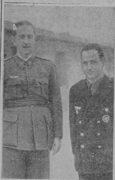
Hace ahora quince años fallecía en accidente el as de la Aviación española, García Morato, que en la fotografía aparece en compañía del general Kindelán, poco antes de su trágica muerte en Griñón.