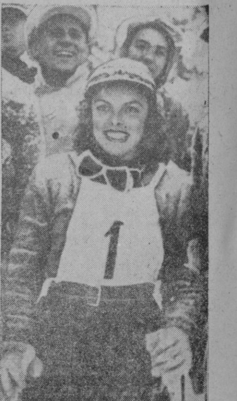
La señorita acaba de conseguir el título de campeona. La sonrisa afluye abundante a sus labios ante la admiración de propios de cualquier prueba deportiva para el triunfador, que acaba por lucir el número uno de la especialidad.