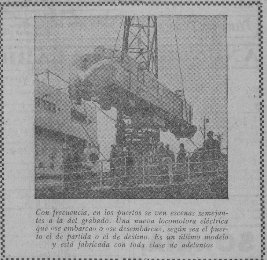
Con frecuencia, en los puertos se ven escenas semejantes a la del grabado. Una nueva locomotora eléctrica que «se embarca» o «se desembarca», según sea el puerto el de partida o el de destino. Es un último modelo y está fabricada con toda clase de adelantos

Las llamadas reformas introducidas y aun por introducir en los organismos ejecutivo y representativo de Túnez—reformas basadas en el principio de la participación francesa y del mantenimiento de la preponderancia de la política francesa—, han sido condenadas por todas las organizaciones representativas de la nación tunecina. En vez de restaurar la soberanía tunecina, las reformas sólo agravan las dificultades y el malestar del Protectorado francés. «Los tunecinos, por tanto—terminó diciendo Ladgham—, no pueden hacer otra cosa que rechazar esta caricatura de negociaciones, lamentando al mismo tiempo que el Gobierno francés no haya sacado las conclusiones más aprovechables de una crisis cuya solución dependía de él mismo».—Efe.