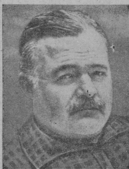
Aquí tienen ustedes al célebre escritor norteamericano Ernest Hemingway, que después de haber escapado con vida, por verdadero milagro, del accidente de aviación que sufrió en una selva americana infestada de fieras, ha encontrado una bonita distracción en leer las diversas noticias dándole por muerto, y tan contento de vivir en espera de esa "muerte literaria" que le gustaría tener, según ha dicho.