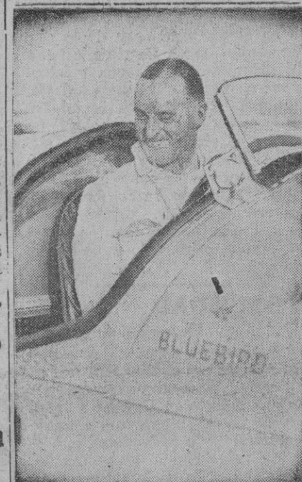
Les presentamos al famoso sir Malcolm Campbell, fotografiado en su «Pájaro Azul» («Bluebird») dice el original y nosotros ponemos la traducción literal) después de una de las sesiones de entrenamiento verificada en el lago Ginebra. Sabido es que el conocido «acrobata acuático» ha alcanzado excelentes marcas de velocidad a bordo de sus bólidos.