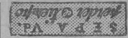
CRUCIGRAMA N.º 910 Por Mirospa

El esqueleto de la mujer está construido en aluminio y los sistemas sanguíneo, linfático y nervioso son de alambres de colores. Los intestinos, corazón, pulmones y otros órganos están hechos en plástico con tonos correspondientes. Una complicada red eléctrica ilumina diversas partes del cuerpo.