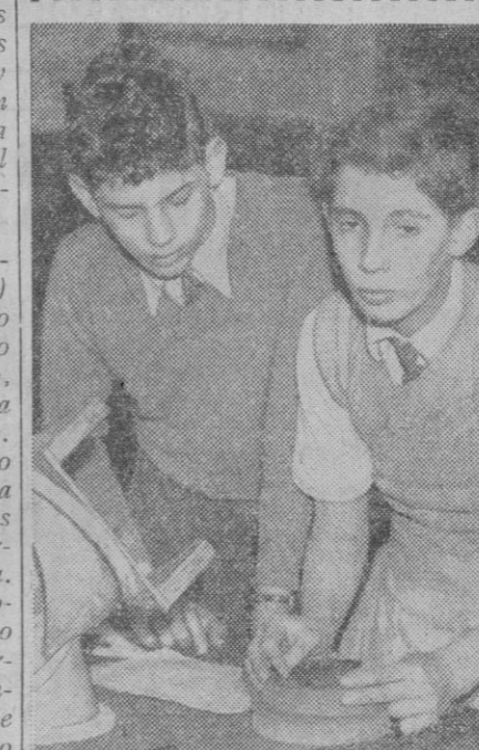
Juventud que promete. Juventud trabajadora. Esperanza de una nación. Así, desde jóvenes, acostumbra su cuerpo al trabajo. Sus manos aprenden a manejar con habilidad cualquier instrumento textil, mecánico...

Roma, 12.—Amintore Fanfani ha aceptado el encargo de formar el nuevo Gobierno.—Efe.