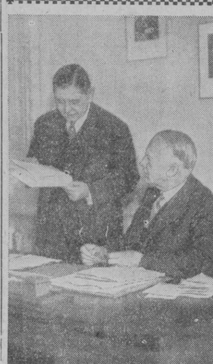
Esta fotografía nada tiene de particular. Precisamente ahí está su mérito. La escena, igual o parecida, se repite diariamente en muchos lugares: oficinas, redacciones, industrias... El presidente, el director, el gerente, da instrucciones. El ayudante escucha, pregunta, pide indicaciones. Una y otra vez. Un día y otro. La vida sigue su curso normal. Y la escena, una vez más, se repite. Sencilla, natural. Pero, precisamente ahí está su mérito.

en litigio su disciplina interior. Después de 1948, por el cual el mismo año, fueron encarcelados y conducidos a campos de prisioneros otros tres obispos que, como tales, habían sido dejados de reconocer por el Gobierno comunista, pero que aun gozaban de libertad. Monseñor Cisar fué desterrado a un monasterio y se le impidió en absoluto el gobierno de su diócesis.