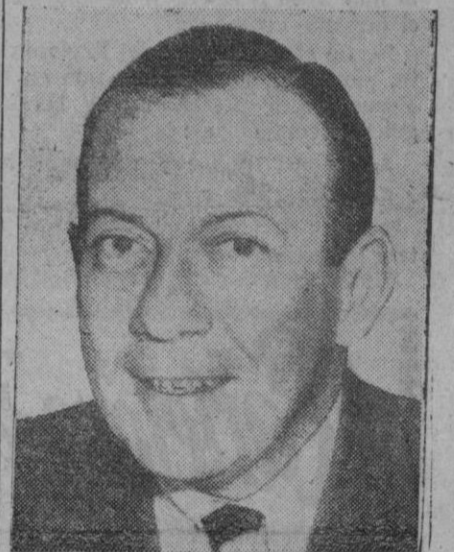
Robert F. Wagner, que en las últimas elecciones de alcaldes en los Estados Unidos, ha resultado elegido para Nueva York, sucediendo así en el cargo a Impellitteri, que venía desempeñándolo.

Milán, 12 (4 t.).—El caso del ciclismo italiano Gino Bartali ha dado su primer pase, después de haber quedado restablecido de las heridas que sufrió en el accidente de automóvil del pasado 18 de Octubre.—Efe.