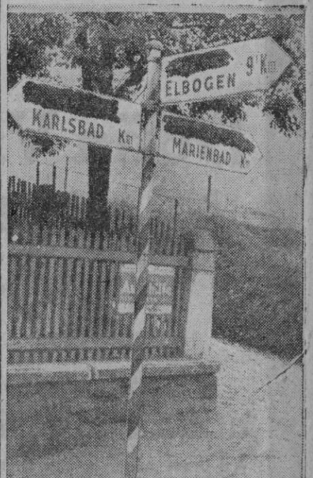
Este indicador—triple y todo—no tiene nada de particular. Es decir, si tiene algo: nos ha recordado que, en nuestra capital—ya lo hemos insinuado otras veces—se precisa alguno más. Y no pedimos que sean con este precisamente, sino que con otros más sencillos, pero eficaces, nos conformáramos.

Chicago, 8 (4 t.).—Los accidentes mortales ocurridos en el país, desde las 24 (hora española), del pasado viernes, según una encuesta de la agencia United Press, se elevan a 522, por accidente de tráfico, ahogamientos, accidentes aéreos y accidentes diversos.—Efe.