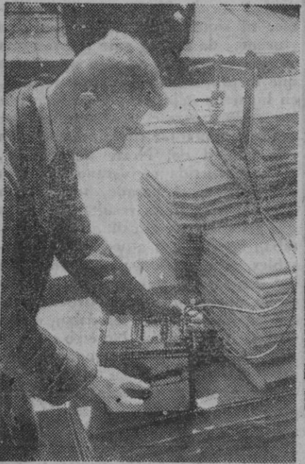
Estos, al parecer, raros y extravagantes artefactos, no son otra cosa sino componentes de un higrómetro construido en Alemania y que es empleado por los carpinteros para examinar el grado de humedad de un bosque, o simplemente de la madera ya cortada. Como se ve, el carpintero ya no emplea sólo el metro para medir.

lo la llegada de Su Excelencia el Jefe del Estado, que rendía viaje en tierras de Aragón a una etapa triunfal de inauguraciones y de realizaciones magníficas.