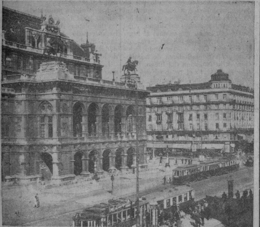
El grabado representa el majestuoso edificio de la Opera Nacional de Viena. Su vista nos hace pensar en otros tiempos dorados, cuando a orillas del Danubio, florecía el «bel canto» en la garganta de famosos divos, y la pequeña canción romántica brotaba del arco del violín de artistas bohemios y jefes.