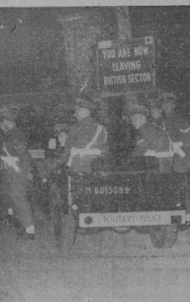
Berlin es la ciudad del mundo que mayores consecuencias ha sufrido por participar en la última guerra mundial.

La posguerra ha hecho de Berlín su presa predilecta, dividiéndola en los dos famosos sectores de ocupación.