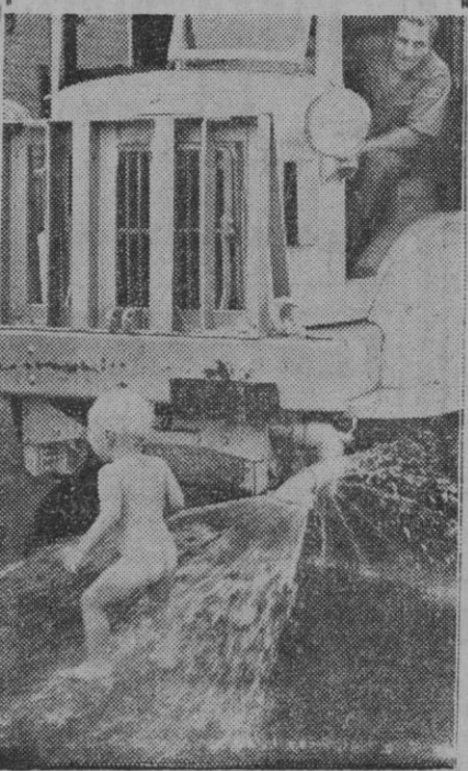
Nos gustaría ver el rostro de ese niño, pero adivinamos su gesto, con los ojos cerrados y los labios apretados. Aguantará bien y demuestra lo que será: un valiente.