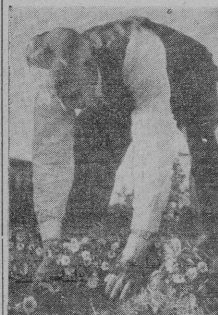
El cultivo de flores es uno de los mayores entretenimientos y uno de los mejores descansos que puede proporcionarse un hombre. Este señor apura los últimos días de sol en el jardín de su casa cuidando unas plantas que desaparecerán en cuanto el frío haga su aparición con su implacable ley.