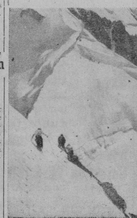
Este es el aspecto del célebre Mont Blanc durante la temporada de invierno. Se trata de uno de los lugares más apetecibles para el recreo y de uno de los centros deportivos invernales de mayor consideración. Dentro de unos días se cubrirá de nieve como en la foto y así permanecerá durante todo el invierno.