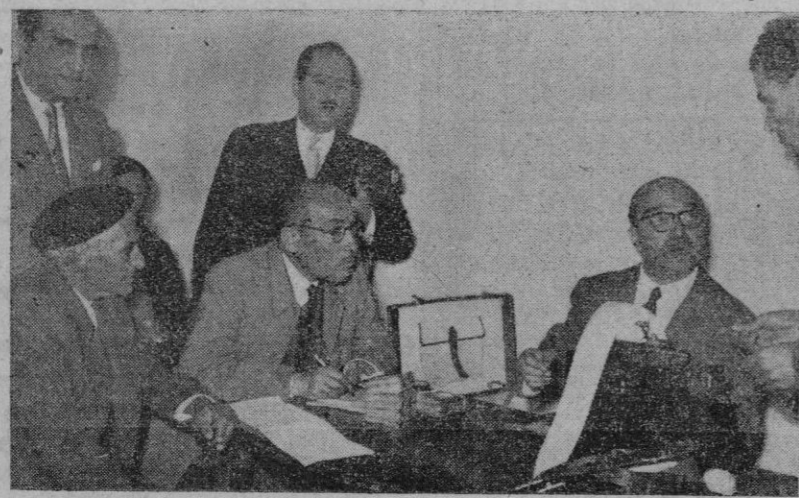
Momento de la entrega de cuatrocientas mil pesetas prestadas a los labradores de Torreiglesias (Segovia) por la entidad de Crédito y Ahorro «Cibeles», Caja Previsora de Crédito, de Barcelona

Un grupo de labradores de Torreiglesias (Segovia), que se han convertido en propietarios de las tierras que desde tiempo inmemorial venían cultivando sus antepasados