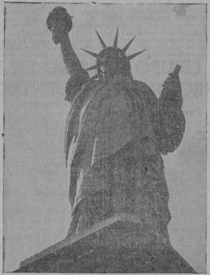
El próximo día 28 se conmemorará el sesenta y seis aniversario del descubrimiento de la estatua de la Libertad en el puerto de Nueva York. Se levanta a una altura de noventa y tres metros y se debe a la idea de un escultor francés. Representa a una mujer que rompe unos grilletes con los pies. Es, sin duda, uno de los monumentos más famosos en el mundo entero.