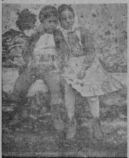
Esta pareja de sicilianos da una idea de lo dulce y lo expansivo de su carácter en la intimidad, aunque después estas virtudes no se extiendan demasiado a las relaciones con los extranjeros.