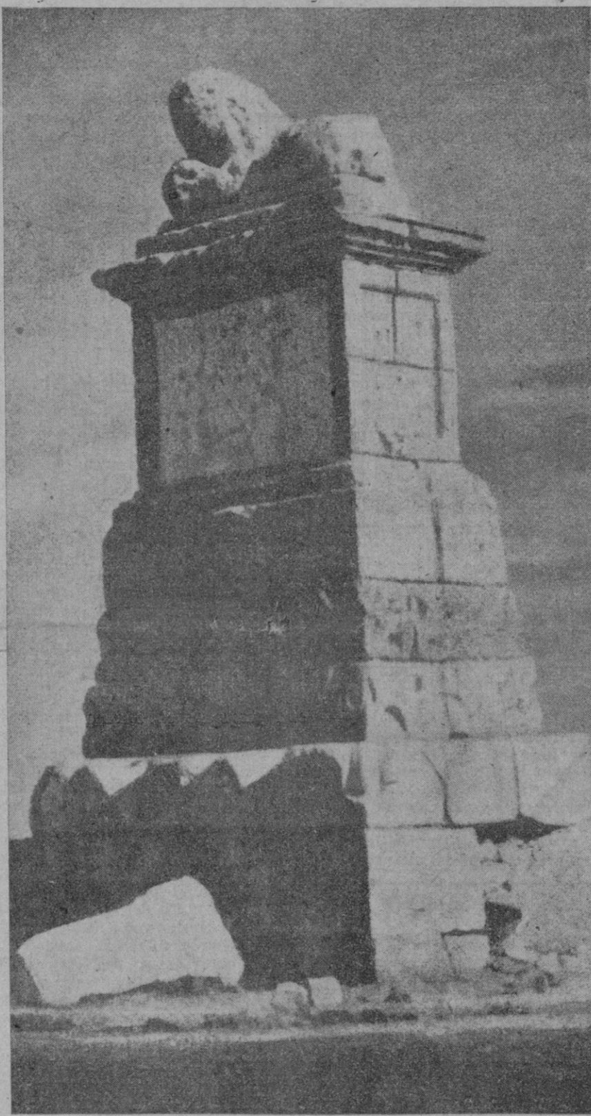
En torno a este monumento, símbolo de la Cruzada, se reunieron los ex combatientes españoles. La gran concentración que se efectuó bajo la figura del Caudillo, añade un motivo a la grandeza histórica de este monumento, hoy representativo de una de las mejores hazañas patrióticas