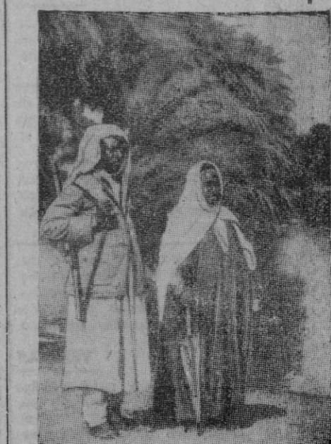
Todo el Oriente está revuelto. Las inquietudes han pasado también a Africa y los tipos más característicos han perdido su habitual tranquilidad y su aspecto pacífico, agarrándose a las armas.