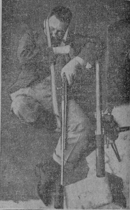
La rara postura que el señor pone no se debe más que a que es un tirador que espera el turno en un concurso y según él de esta forma no perderá la puntaría de una tirada para otra. La razón, la ignoramos.