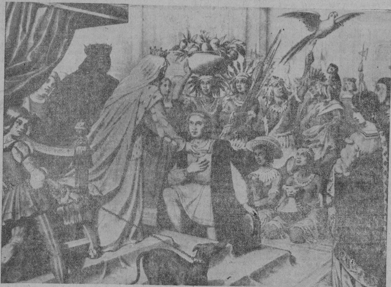
Ayer se conmemoró en todo el mundo hispánico el día de la hispanidad. Es sin duda una de las fechas más gloriosas y de mayor júbilo para el pueblo español y para la raza hispánica. En esta grabado que reproducimos se recoge y se acentúa el sentimiento y la esencia del histórico 12 de Octubre. Isabel y Fernando, símbolo de lealtad cristiana, reciben a Colón en Barcelona después de haber extendido por la nueva tierra el pabellón español.

Desde primeras horas de la mañana las calles ofrecían un brillante aspecto, engalanadas con banderas nacionales y luciendo sus edificios tapices y colgaduras.