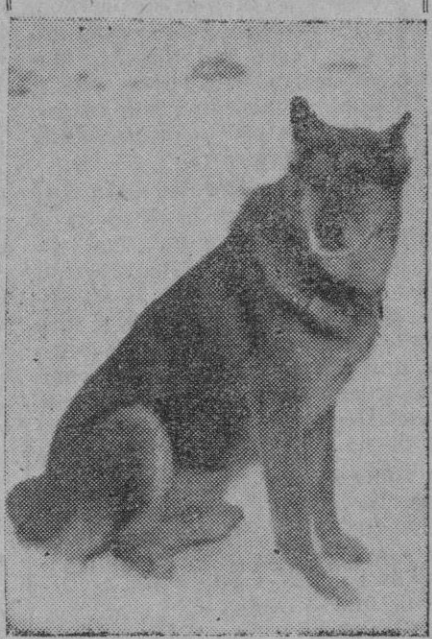
He aquí a todo un héroe. El perro más popular de Dinamarca. Se llama "pan" y su dueño es precisamente un panadero. Ha encontrado la pista de muchas personas perdidas, interponiendo también en la recuperación de objetos robados. Por fin ha sido nombrado perro honorario de la ciudad.