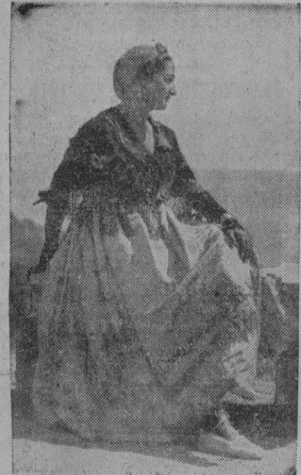
La señorita es una belleza. Desde luego es española. A simple vista se aprecia. Pero aún se puede concretar más, porque el vestido que exhibe es típico de la región catalana.

El señor Cavestany recorrió todas las dependencias del Centro y escuchó las explicaciones que le fueron facilitadas sobre el funcionamiento y régimen de enseñanza.—Cifra.