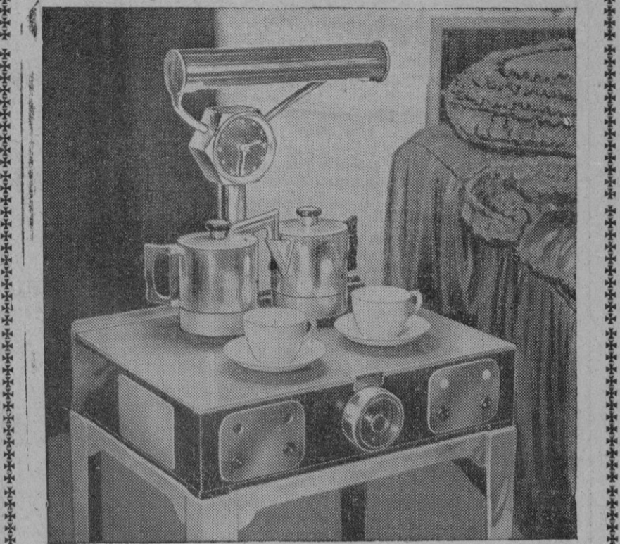
Es difícil, acostumbrados a nuestro sentido de la estética, imaginar el efecto que haría este aparato, a la cabecera de la cama, sustituyendo a la mesilla de noche. Sólo puede tolerarse la idea, pensando en que no es preciso levantarse de la cama para tomar el desayuno caliente