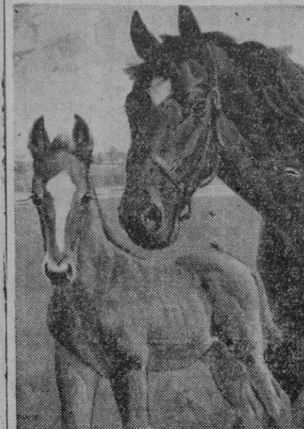
La yegua madre con el potrillo, se han retratado sin rehuir la cámara. La yegua es de carrera y en la línea del potrillo se observa la sangre heredada. Algún día el pequeño hará su hazaña en el hipódromo y será el orgullo de la madre.