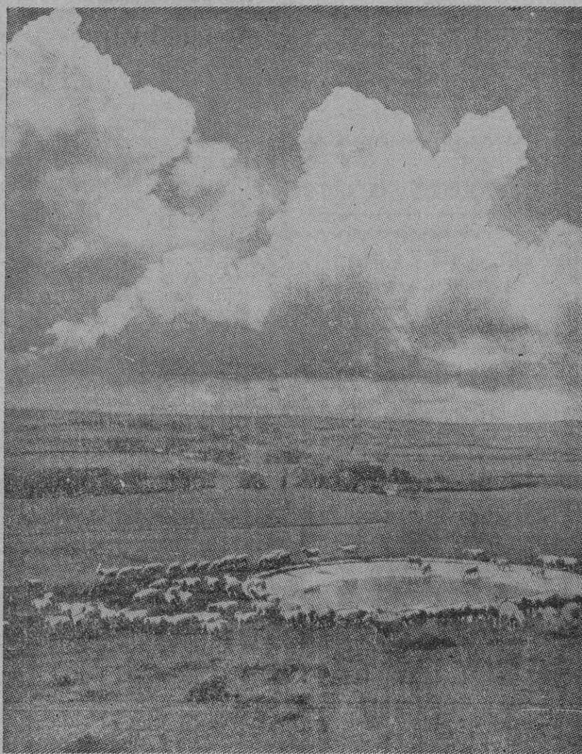
Este conmovedor paisaje de la sierra, con las nubes que se levantan al fondo, es de lo más completo que puede darse. Para que nada falte en el aspecto bucólico, en el pequeño lago el rebaño bebe pacífico.