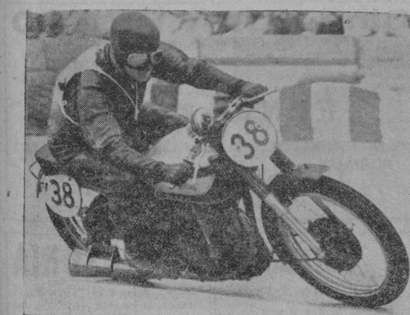
El motorismo es, posiblemente, el deporte que más incremento ha tomado en estos últimos tiempos. En la foto, el ganador de una importante prueba Europea, en París, sobre una "Norton" de 500 cc.

3 Con mayor motivo queda prohibida la admisión de mujeres en hábito de hombre, ni con pretexto de estar en disposición de ir al deporte o si se trata de mujeres extranjeras.