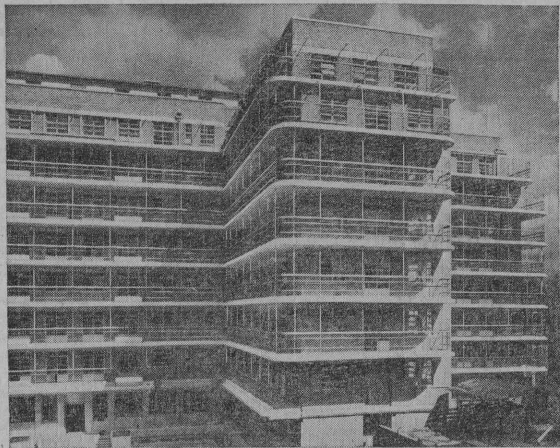
Este imponente edificio ha sido construido en Londres. Pero muy bien podría pertenecer a un barrio del moderno Madrid...