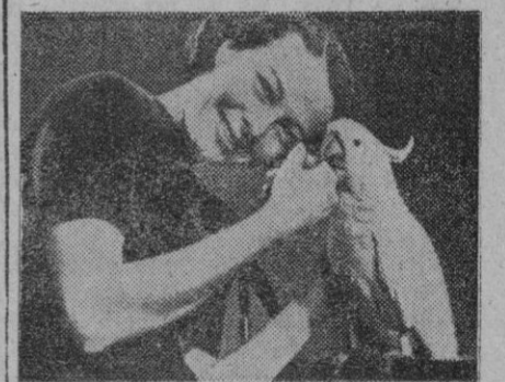
El loro (a la derecha) y la señorita (a la izquierda) son íntimos amigos.

Ilse Werner es la señorita, actriz alemana, que compone este emotivo cuadro con su mascota.