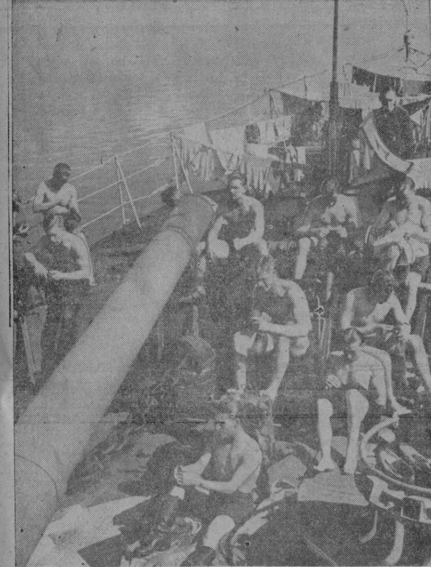
Estos marineros de un destructor británico, que pueden llegar a ser unos héroes, se entregan aquí, en cambio, a las labores no propias de su sexo.

La guerra, que fué siempre para hombres, es el único sitio donde los varones hacen lo que fué siempre para mujeres.