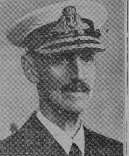
El rey noruego Haakon VII, que cumplirá ochenta años el 3 de Agosto