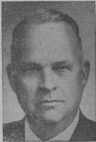
Richard B. Russell, senador por el Estado de Georgia

Estos son los posibles candidatos demócratas