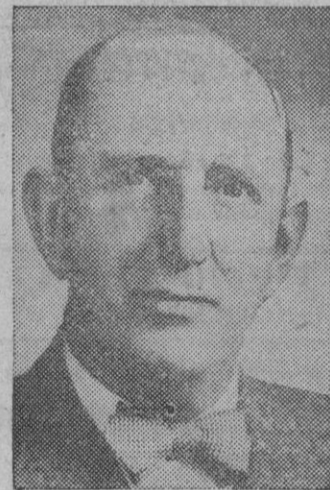
Robert S. Kerr, senador por el Estado de Oklahoma