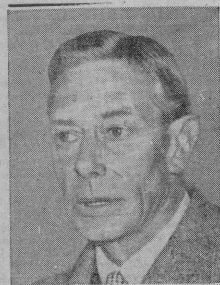
La más reciente fotografía de Jorge VI de Inglaterra obtenida después de su enfermedad.

El calor lo proporciona una pequeña batería de pilas