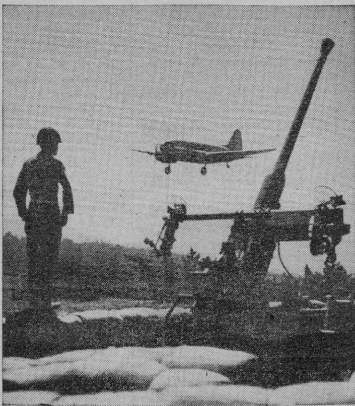
Un soldado de una pieza antiaérea norteamericana en el Japón, contempla el aterrizaje de un transporte militar norteamericano

Soria, 23.—Ayer y hoy han sido los dos días más fríos del presente invierno. El termómetro ha registrado, a las siete de esta mañana, once grados bajo cero.—Cifra.