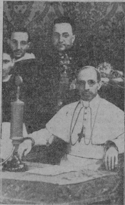
Su Santidad el Papa Pío XII, felizmente reinante, fotografiado ante los micrófonos de Radio Vaticano, en el momento de pronunciar un mensaje radiodifundido

Se suele acusar a la fe cristiana de consolar al mortal que lucha por la