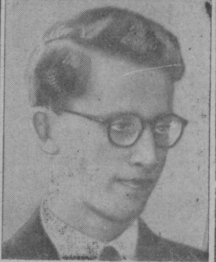
El Príncipe Balduino

Todas estas becas han sido concedidas por intermedio de la Sociedad Oftalmológica Hispanoamericana.—Logos.