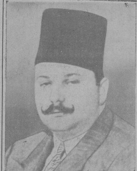
El Rey Farouk, de Egipto, de quien se dice que va a contraer matrimonio con Narriman Sadek, de 16 años, hija de un funcionario diplomático egipcio