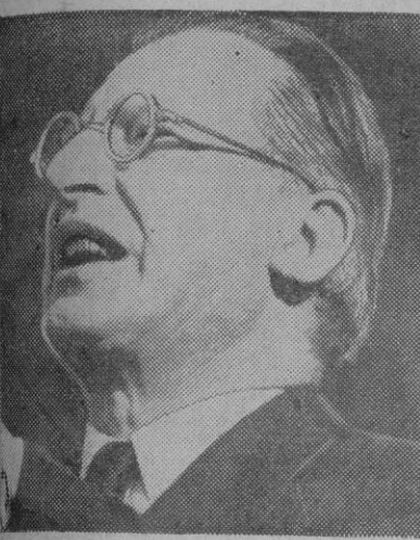
El jefe del Gobierno italiano, De Gasperi

Ha sido hallada una bomba cerca de la casa donde asistía a una boda