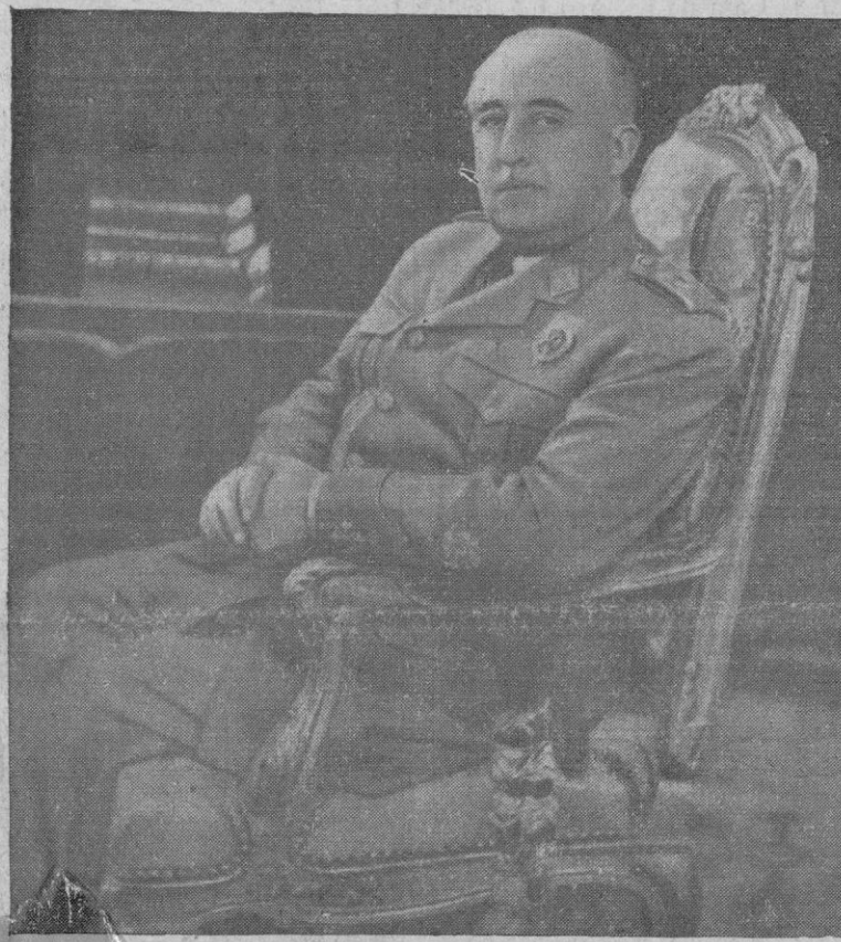
Su Excelencia el Jefe del Estado español, quien en su importante mensaje de Año Nuevo, dirigido al pueblo español, abre horizontes de fe y optimismo en los destinos patrios y expresa el anhelo de que 1950 sea venturoso para la nación. Nosotros pedimos fervientemente a Dios que siga iluminando la mente de nuestro Caudillo para que en este año que comienza alcance la Patria la plenitud de su reconstrucción y reine en el hogar cristiano de Francisco Franco la ventura que él ambiciona para todos los españoles

Washington, 1.—El secretario de Estado, Dean Acheson, anuncia que tan pronto como se reúna el Congreso, el martes próximo, se celebrará un debate general sobre política exterior norteamericana. El senador Connally, presidente del Comité de Relaciones Exteriores del Senado, dijo que propondrá, en la primera reunión de dicho Comité, que Mr. Acheson sea invitado a una sesión del mismo, a puerta cerrada. Se cree que en dicha sesión se tratará de cuestiones relacionadas con la política norteamericana respecto a Asia e Israel, y de la posibilidad de extender la ayuda económica del Plan Marshall a Tiro. También se tratará de la posible reanudación de relaciones plenas con España.—Efe.