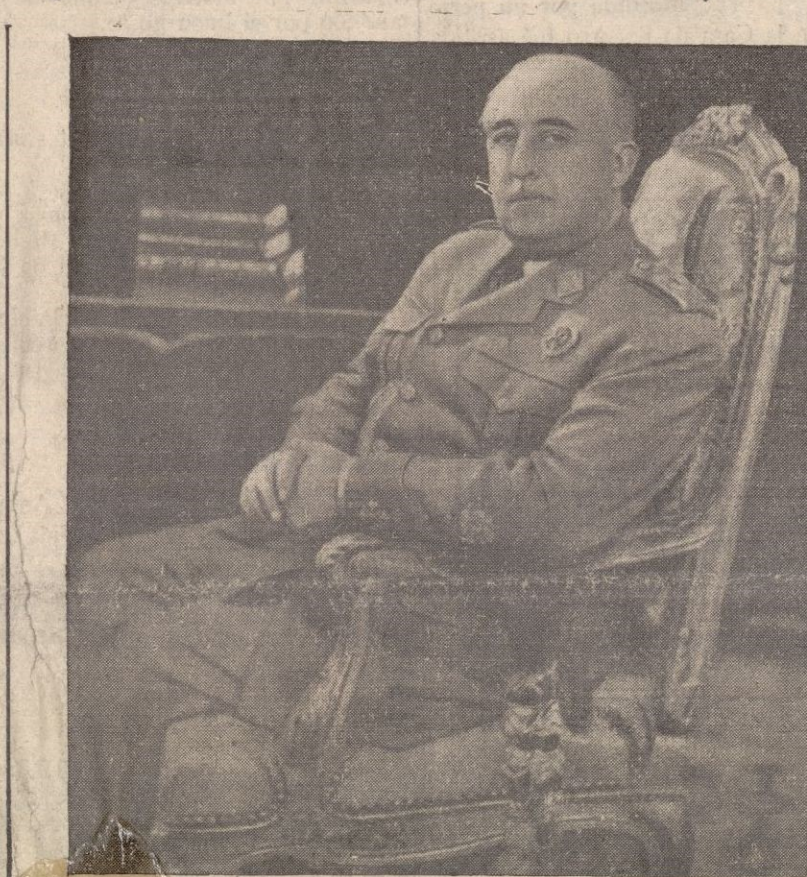
Su Excelencia el Jefe del Estado español, quien en su importante mensaje de Año Nuevo, dirigido al pueblo español, abre horizontes de fe y optimismo en los últimos días de 1949 que venidero para la nación. Nosotros pedimos fervientemente a Dios que siga iluminando la mente de nuestro Caudillo para que en este año que comienza alcance la Patria la plenitud de su reconstrucción y reine en el hogar cristiano de Francisco Franco la ventura que el ambicioso para todos los españoles

También se tratará de la posible reanudación de relaciones plenas con España.—Efe.