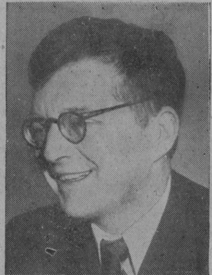
Olafurs Thors, jefe del partido conservador de Islandia, que ha sido proclamado Presidente al constituirse el nuevo Gobierno