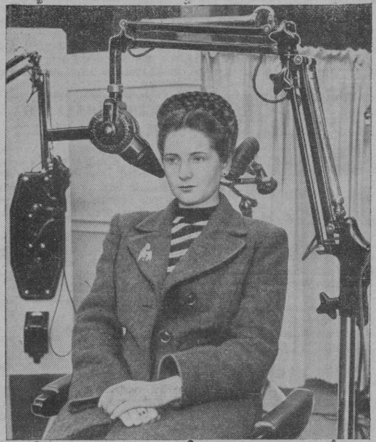
El pie de esta fotografía no dice más que se trata de una prueba del aparato portátil de rayos X, especialmente preparado para los odontólogos, con peso no superior a los cinco kilos. Y es de sentir este laconismo, porque la belleza y atención de la señorita que se escogió para la prueba, merecido tenían que se les dedicara unas líneas