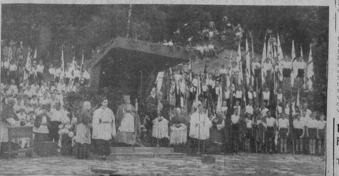
El día 17 de Julio, los católicos del sector del Este de Berlín celebran las bodas de oro sacerdotales del Papa Pío XII. En el estadio olímpico de Berlín, 30.000 católicos estuvieron presentes escuchando, por radio, al Papa, que les habló en alemán. Después, el cardenal Preysing, bajo palio, dirigió la palabra a la muchedumbre, momento que está recogido en esta fotografía.