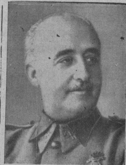
Su Excelencia el Jefe del Estado

El general articulista planteó a Franco esta cuestión: «¿Cuál es, Excelencia entre las ideas que habéis abordado, la que os parece actualmente la más importante? Me respondió, después de una corta reflexión: —LA LATINIDAD (en versales (Continúa en la página 3)