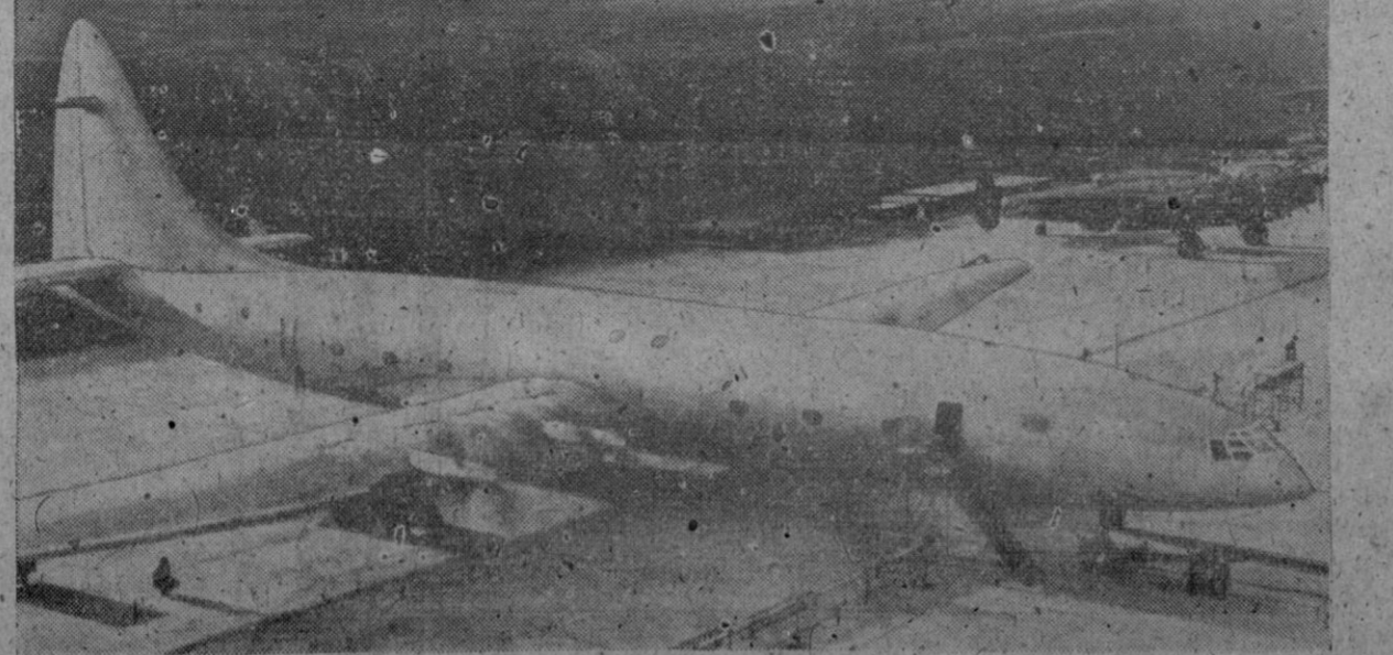
He aquí el avión «Brabazon V». La envoltura del avión es de más de 75 metros y tiene capacidad para cien pasajeros. Su tripulación es de siete hombres. Los ocho motores que lleva están dispuestos de tal forma que se puede atender a su vigilancia en pleno vuelo.