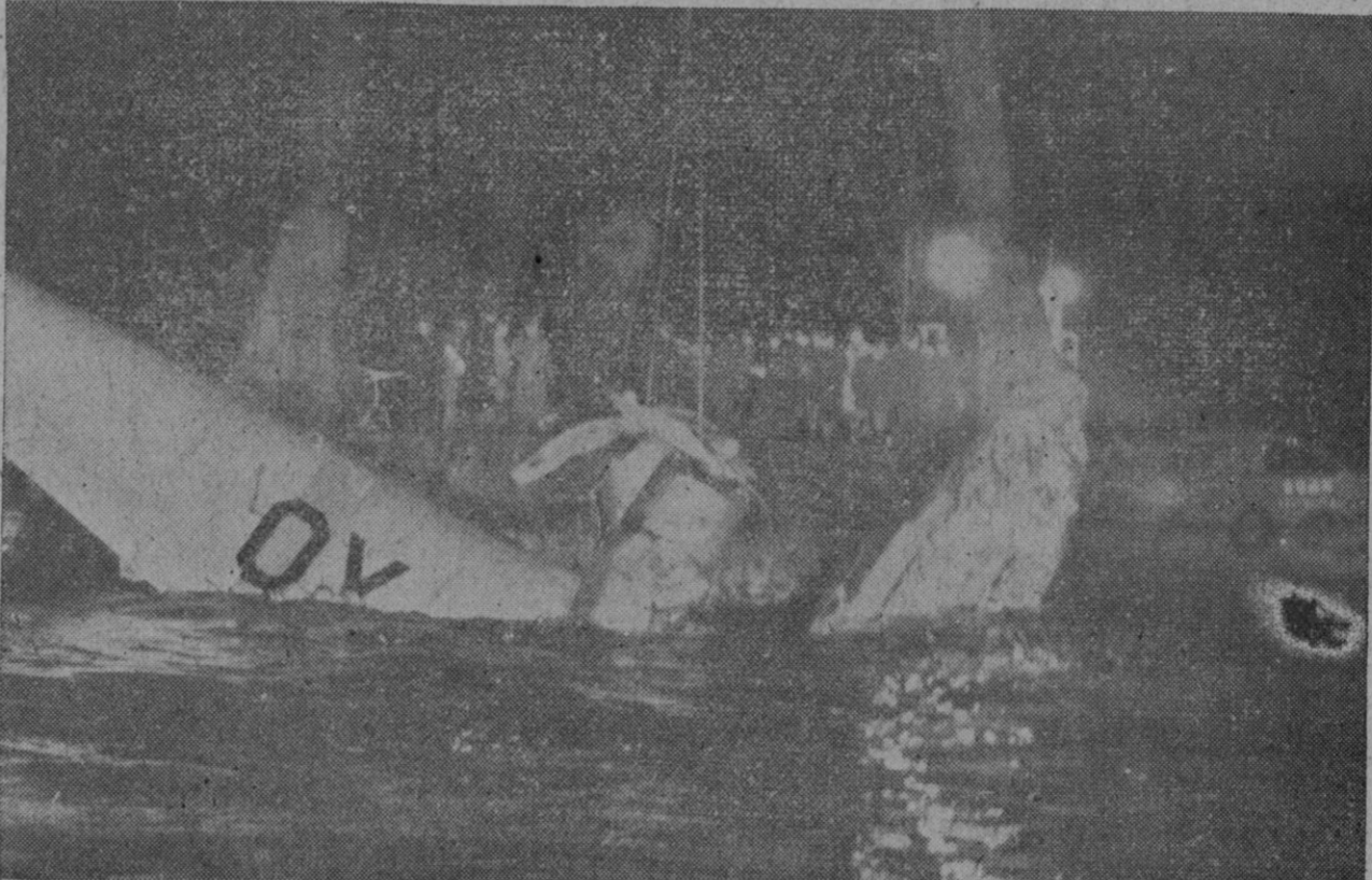
He aquí una foto de los trabajos de recuperación del avión danés que se hundió en el estrecho de Oresund con veintinueve pasajeros españoles a bordo y la tripulación danesa, todos los cuales perecieron en la catástrofe