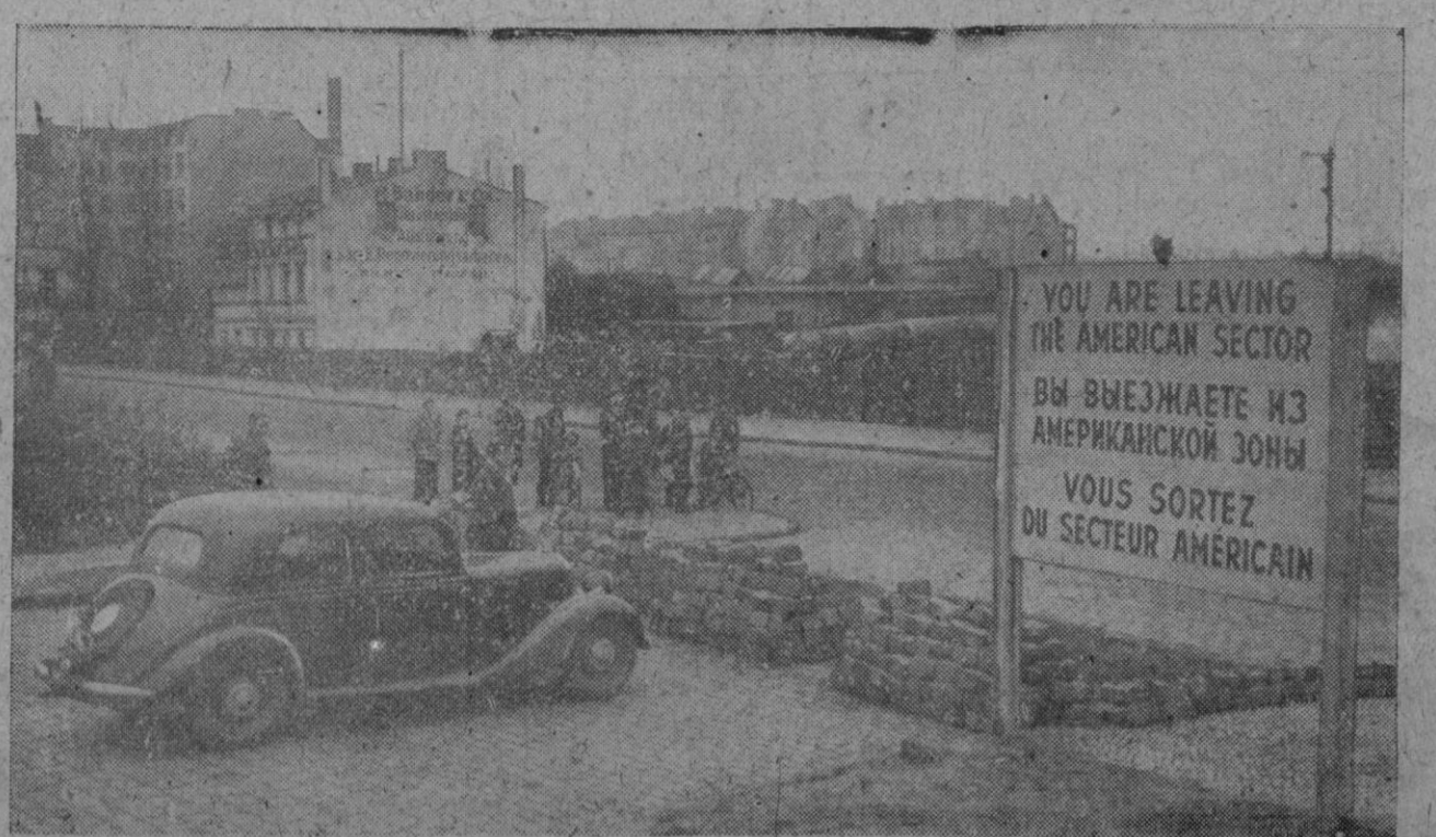
Los soviets han levantado barricadas en todas las vías que desembocan en los sectores del Oeste de Berlín. En la foto vemos una de ellas en la que solamente queda abierto un estrecho pasillo para peatones