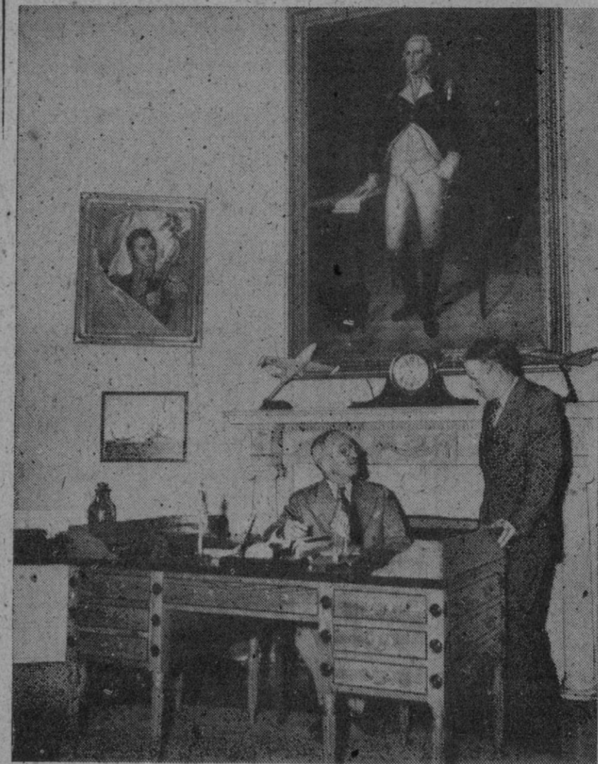
Primera fotografía del Presidente Truman obtenida en su gabinete de trabajo en la Casa Blanca después de prestar juramento como Presidente reelegido. El gran retrato que preside el recinto es del primer Presidente de los Estados Unidos, George Washington