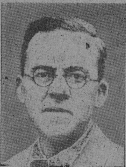
Sir Stafford Cripps