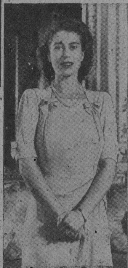
La princesa Isabel

Londres, 25 (7 t).—La princesa Isabel de Inglaterra sufre un ataque de sarampión, según se ha anunciado oficialmente. Añade el comunicado que no reviste gravedad. La princesa Isabel se halla en el castillo de Sandringham, con su hijo el príncipe Carlos.—Efe.