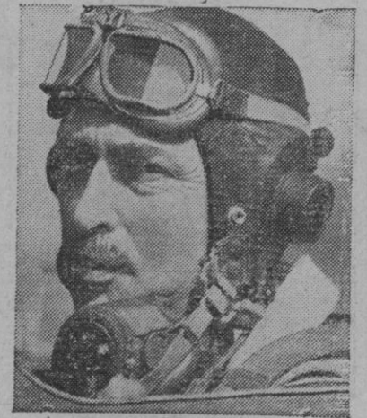
El mariscal del Aire sir James Robb, nombrado comandante en jefe de las fuerzas aéreas de la Europa Occidental por los Gobiernos de las Potencias del Tratado de Bruselas