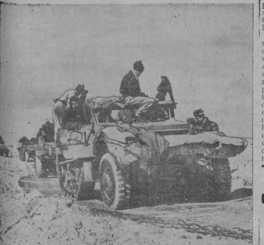
Fuerzas judías motorizadas operando en la región de Negeb, dentro de territorio egipcio

Respetarán mutuamente la soberanía y la seguridad nacional de cada país