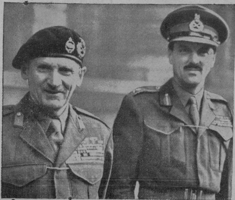
El mariscal vizconde Montgomery—actualmente jefe del Estado Mayor de la Unión Occidental—, con el jefe de su Estado Mayor, brigadier Renald Belcham, el general más joven del Ejército británico