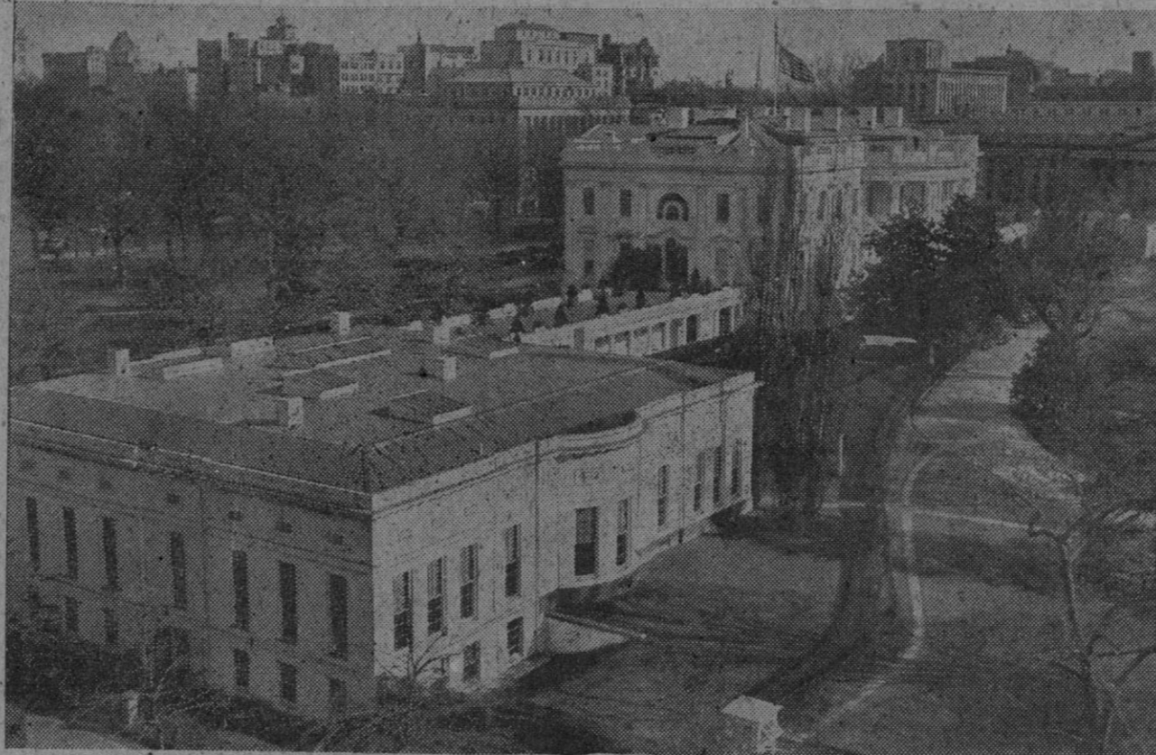
La Casa Blanca, en Washington. En primer término aparecen el edificio de las oficinas de la Administración. ¿Continuará Truman ocupando la Casa Blanca? ¿Le sustituirá en ella Dewey? En estos momentos los norteamericanos se hallan resolviendo esta incógnita.

Nueva York, 2 (7 t.).—El noventa por ciento de la información que publica la Prensa norteamericana está dedicada a las elecciones presidenciales que se celebran en el país.