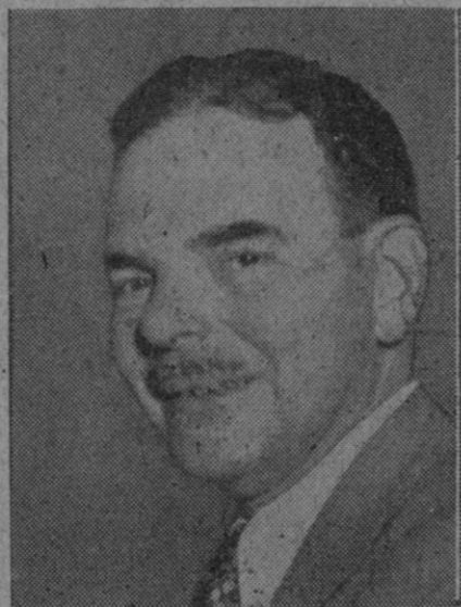
Dewey, candidato republicano a la presidencia