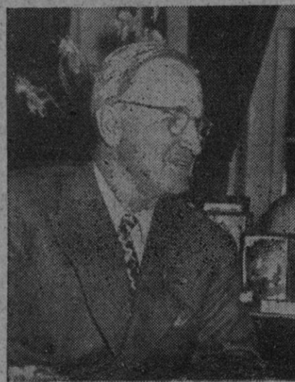
Truman, candidato demócrata a la presidencia

Mañana el ministro marchará a Lisboa. Se defenderá en el Santuario de Nuestra Señora de Fátima, en las ruinas de los históricos Monasterios de Batalha y de Alcobaça.—Efe.