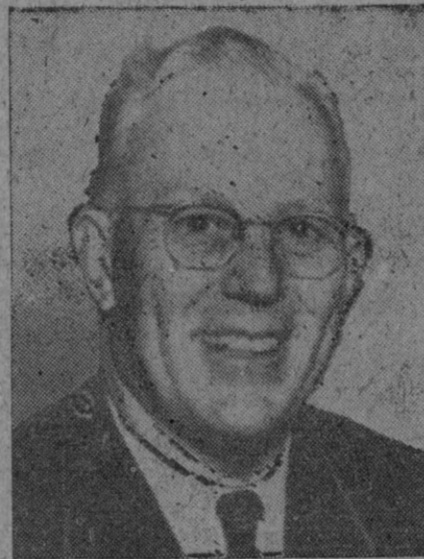
Warren, candidato republicano a la vicepresidencia

Hoy elegirá nuevo Presidente el pueblo de los EE. UU.