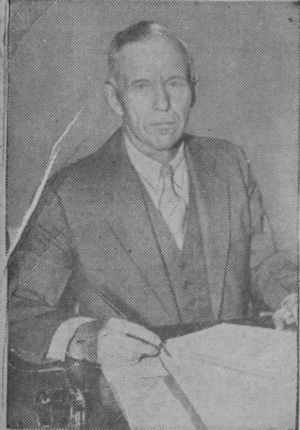
General George Marshall

Washington, 23.—El secretario de Estado, general Marshall, ha ingresado en una clínica de esta ciudad para reponerse del agotamiento físico que sufre.—Efe.