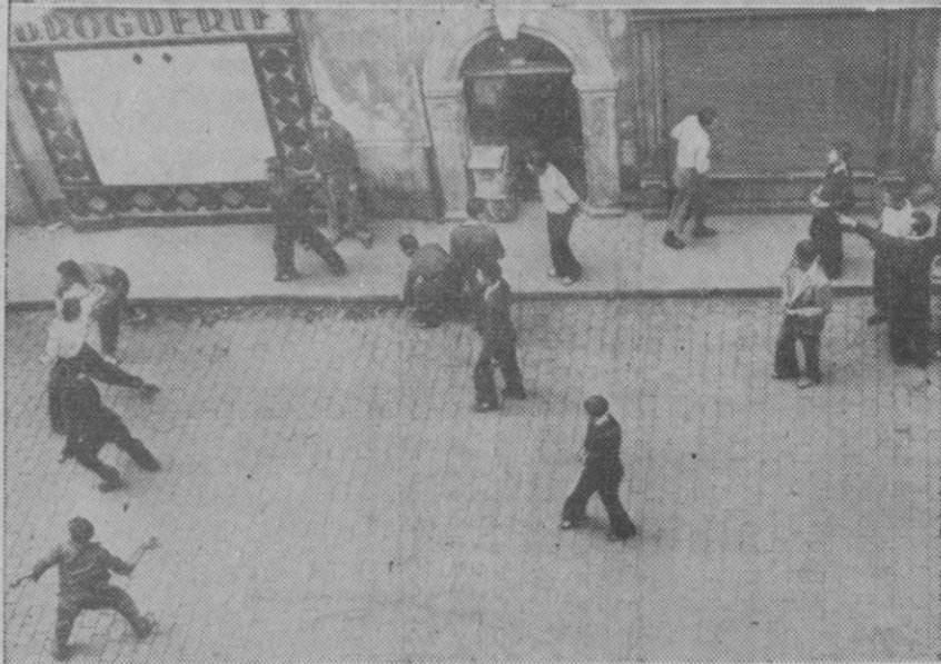
Hace unos días se registraron luchas sangrientas entre huelguistas y Policía en la ciudad francesa de Clermont Ferrand. Las presentes fotografías—las primeras publicadas en España acerca de aquellos graves sucesos—recogen dos aspectos de la lucha