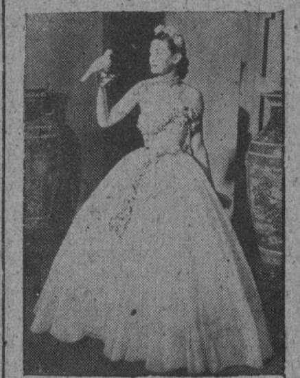
En un reciente desfile de modelos se presentó este traje de organza blanco adornado con guirnalda de florecitas