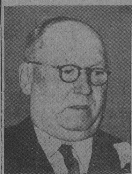
Daniel F. Malan, nacionalista, que ha triunfado en las elecciones generales de África del Sur, venciendo al mariscal Smuts. Malan ha constituido ya el nuevo Gobierno

Nueva ofensiva judía Londres, 8 (r. t.).—La radio de